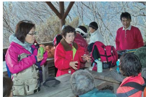
下り休憩のひと時▼

家族で 気楽にとも思ってきたけども、遊友の 山行良かったです、おみかん買ってビタミンC とって梅の花もたくさん見てきて良い日が過 せました。《高橋》